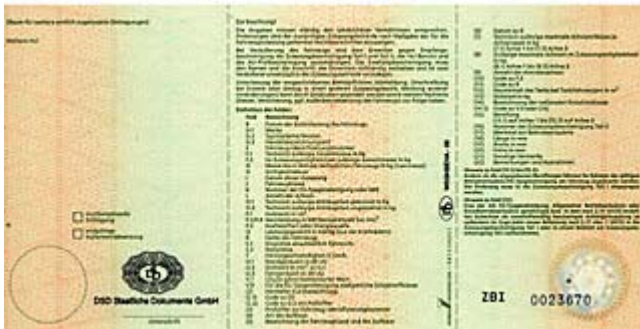
Zulassungsbescheinigung Teil I (Fahrzeugschein)